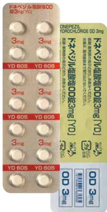
ドネペジル塩酸塩OD錠 3mg[YD]