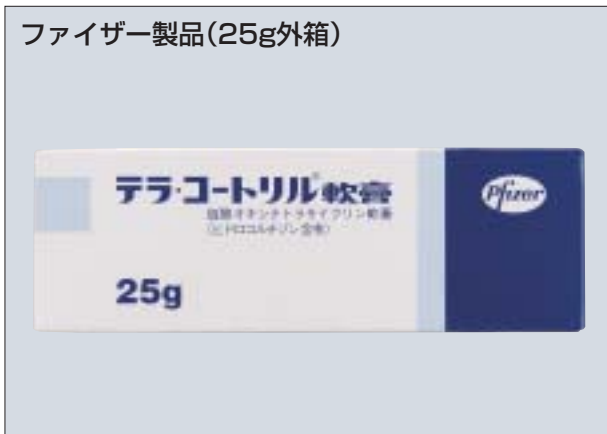
ファイザー製品(25g外箱)