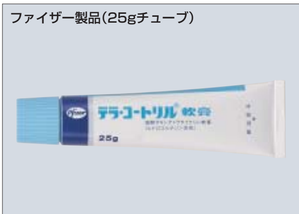
ファイザー製品(25gチューブ)