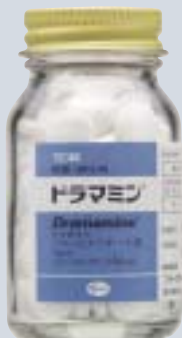
ファイザー製品(100錠瓶)