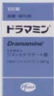
ファイザー製品(100錠瓶外箱)